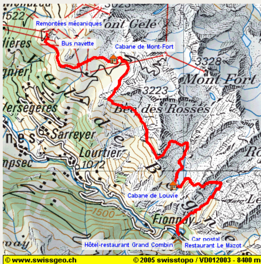
Fiche PDF complète (texte+carte, payant)