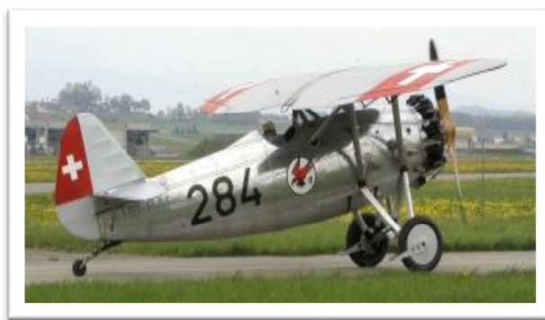
Aérodrome de Payerne Dewoitine D.26 (1931-1948)