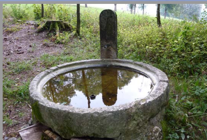
Le Mycorama à Cernier Temple d'Engollon - Christ en Majesté Fontaine de la Bonneville