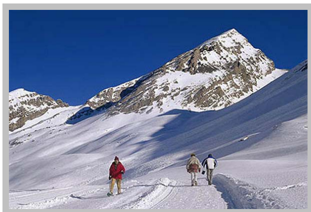
Sentier d'hiver du Col de la Gemmi

Après une petite pause au Col de la Gemmi, nous descendons à Loèche-les-Bains avec le téléphérique. Retour à Neuchâtel en bus puis en train.