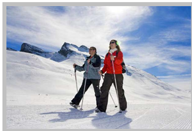
Avec des bâtons de marche c'est plus facile