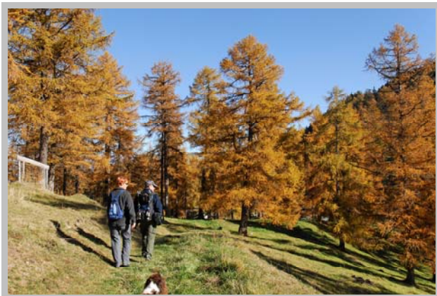
Vers la Tête des Econduits