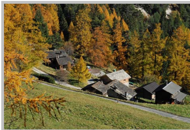
Sous le col des Planches