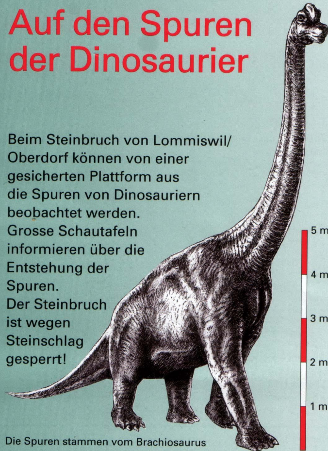
Die Spuren stammen vom Brachiosaurus

Beim Steinbruch von Lommiswil/ Oberdorf können von einer gesicherten Plattform aus die Spuren von Dinosauriern beobachtet werden. Grosse Schautafeln informieren über die Entstehung der Spuren. Der Steinbruch ist wegen Steinschlag gesperrt!