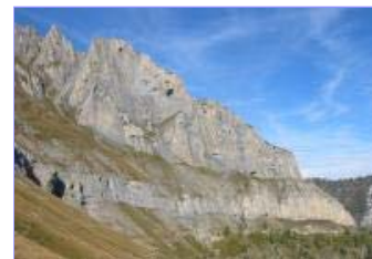
4 - Versant sud du Grand Chavalard

Finalement on suit un large sentier qui va nous ramener à L'Erié en passant sous le Grand Chavalard. Ce versant sud hérissé de multiples tours est le plus impressionnant. On dirait une cathédrale. Heureusement que le sentier est large car il traverse des précipices qui ne se terminent qu'au niveau de la vallée du Rhône. De cet extraordinaire balcon, on aperçoit d'ailleurs la rivière ainsi que l'autoroute. Les bruits de la civilisation ne sont pas loin. En face s'élève le Grand Combin ainsi que quelques autres pics valaisans. L'arrivée au parking d'Erié marque la fin du circuit, 6 heures après l'avoir débuté.