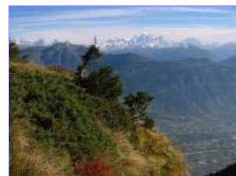
2 - Vallée du Rhône et Grand Combin

30 minutes plus tard, autres chalets, ceux de Petit Pré. Les installations mécaniques d'Ovronnaz sont tout proches. C'est ici que vous rejoindrez le circuit si vous avez privilégié Ovronnaz à l'Erié comme point de départ. On remonte un joli vallon et on passe en bordure du plateau marécageux d'Euloi. Tout autour, des montagnes au belles silhouettes, notamment la Dent Favre, massive, et la Tête Noire, vers laquelle on se dirige.