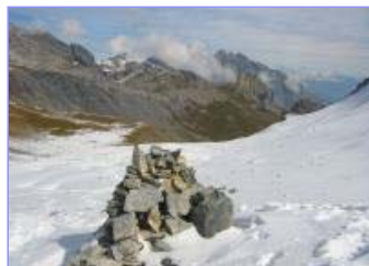
3 - Montée au Col du Fenestral

Eviter de descendre au grand lac de Fully. Mieux vaut garder sa gauche et aller directement au Lac Inférieur (jonction avec un large chemin, maisons). Là on s'engage presque immédiatement sur un sentier qui remonte à gauche. Aucune indication, car il s'agit d'un raccourci. Si l'on reste un peu plus longtemps sur le large chemin, on aura une rude montée quelques centaines de mètres plus loin. On passe le point 2133 de la carte nationale. On bascule ainsi de la face est du Grand Chavalard à sa face sud. D'ici, en voyant les falaises tomber à pic vers Fully, 1600 mètres plus bas, on se rend compte de la situation particulière des lacs de Fully.