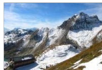
1 - Cabane de Fenestral, Dent de Morcles

J'ai choisi de partir de l'Erié, à env. 1860m (6102ft). S'y rendre en voiture depuis Fully est déjà une expédition en soi. C'est pourquoi il me semble plus raisonnable d'y monter depuis Ovronnaz (panneau "Fully, Eulioz"). Sans voiture, ne pas commencer la randonnée à L'Erié, trop isolé, mais au télésiège de Bougnone, à Ovronnaz. Le parcours est le même, sauf qu'on débute et termine la boucle à un autre endroit.