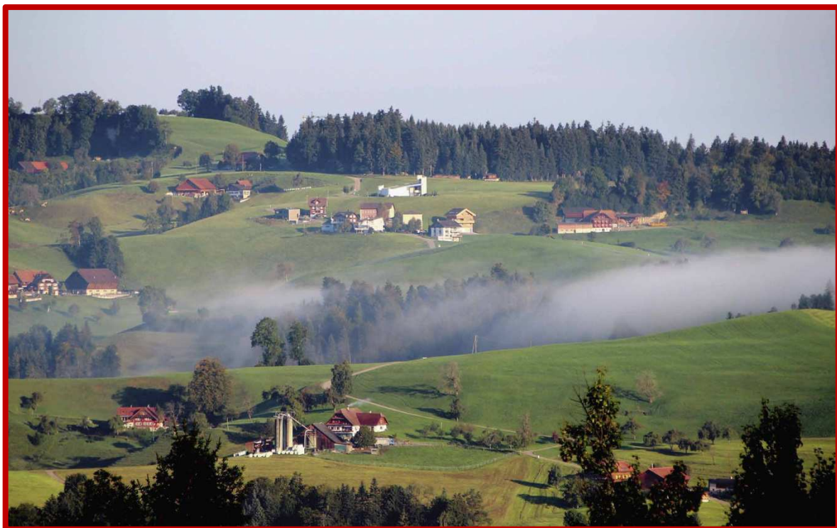
Paysage de l'Entlebuch

En train jusqu'à Entlebuch par Berne. Après une petite pause-café, départ pour Rengg sur les hauteurs du Bramegg avec en cours de route ses paysages de marais préalpins. Une fois sur la crête, on découvre à l'est les collines lucernoises et le Pilate. Pique-nique vers Oberhöhe avant de descendre sur Ebnet-Lindenhof. Retour à Entlebuch en suivant la Petite Emme. Retour en train.