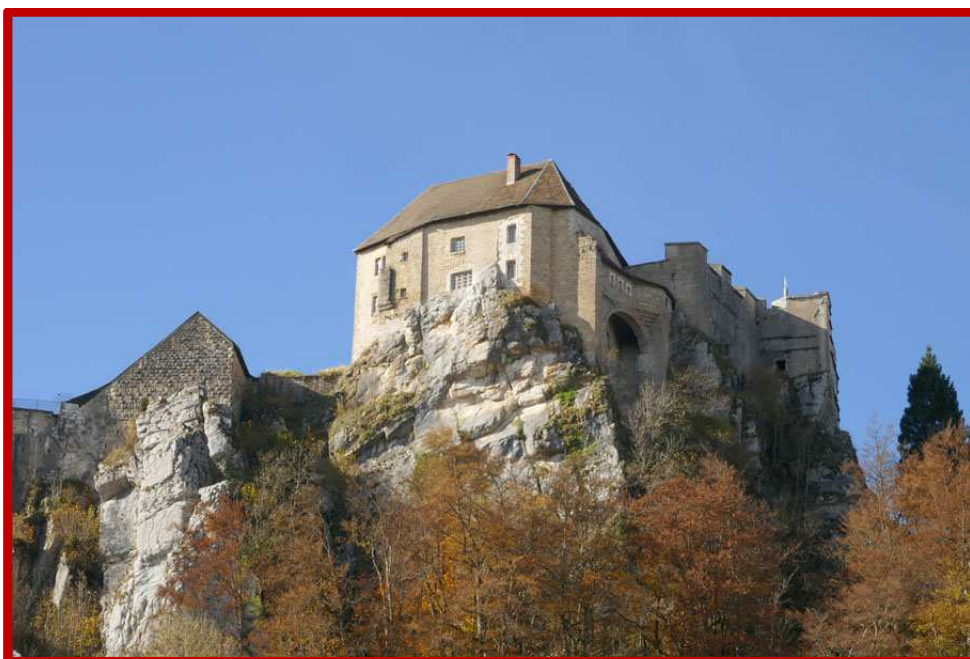
Le Fort de Joux depuis Le Frambourg

Son histoire est riche : le château à connu de nombreux prisonniers, dont le célèbre Toussaint Louverture. Il a aussi connu une période espagnole avant d'être définitivement intégré au royaume de France.