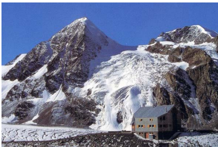
La cabane FXB Panossière

Le lendemain nous continuons sur la moraine puis bifurquons sur le Col des Otanes 2846 m, le point le plus haut de notre randonnée. Puis c'est la descente en direction de Mauvoisin jusqu'à Pazagnou. Ceux qui ont encore un peu d'énergie peuvent passer par la Pierre à Vire et Les Temonés pour aller admirer le lac de Mauvoisin. Possibilité de descendre directement vers l'arrêt du bus de Mauvoisin. Retour à Neuchâtel avec les transports publics.