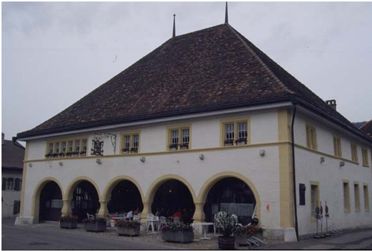
Ici on loge à pied et à cheval