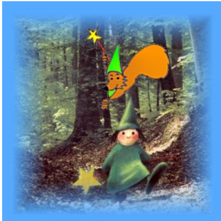
Horogramme de circonstance

Bonne balade tout de même, mais faites attention aux charmes de la Fée Verte.